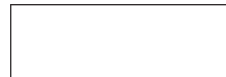
Gabarit d'une perle 6 x 2 cm, à découper 5 fois dans un papier à motifs